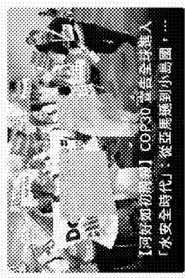
【河好如初頻道】COP30 宣告全球進入「水安全時代」：從亞歷山大到小島國，...