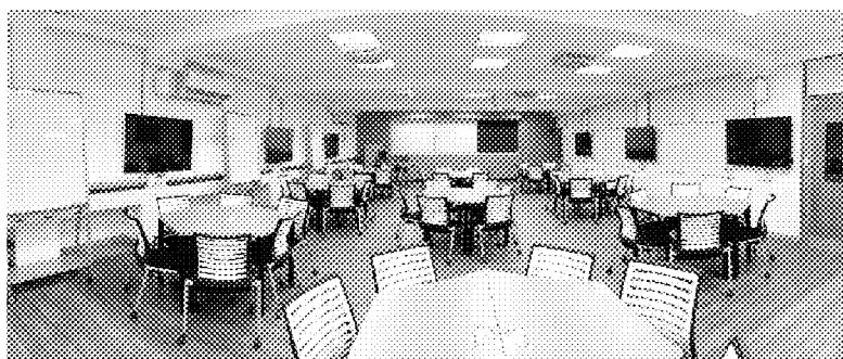
(臺師大校本部 誠104教室)